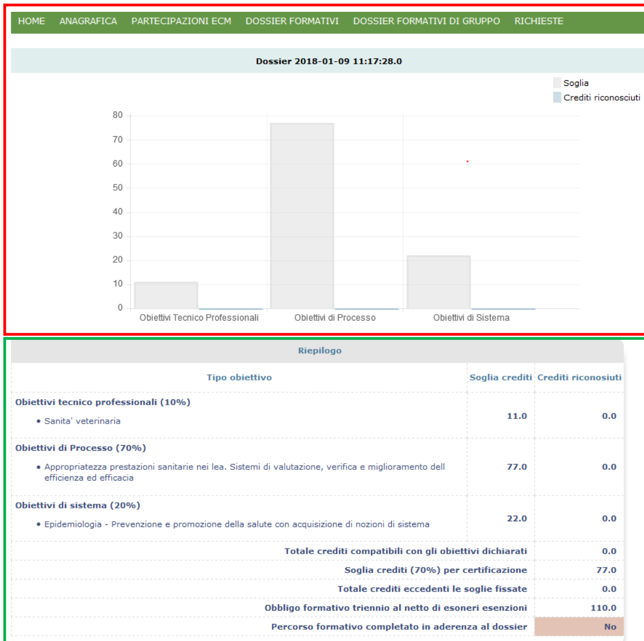
Figura 10: Dettaglio di un singolo Dossier Formativo Individuale.

Soltanto una volta nell'anno solare il professionista ha la possibilità di modificare il proprio Dossier Formativo Individuale al fine di adeguarlo anche a possibili mutamenti di ruolo e di incarico e/o a particolari esigenze formative sopravvenute. Saranno comunque visibili nella posizione generale del professionista, anche eventuali crediti maturati ma non coerenti con il Dossier.